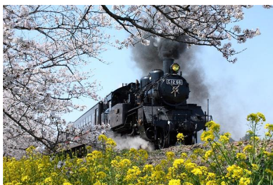
▲ S L もおか

なお、真岡鐵道真岡線では、 2023 年 3 月 18 日(土)にダイヤ改正が予定されています 。S L もおかについても午後の上り列車の時刻に変更がありますので、ご乗車の際はご注意ください。