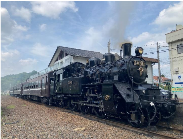
↑ 運転中のSLもおか号

「SLもおか号」の運転を楽しみにされていたお客様や沿線の皆様に深くお詫び申し上げます。