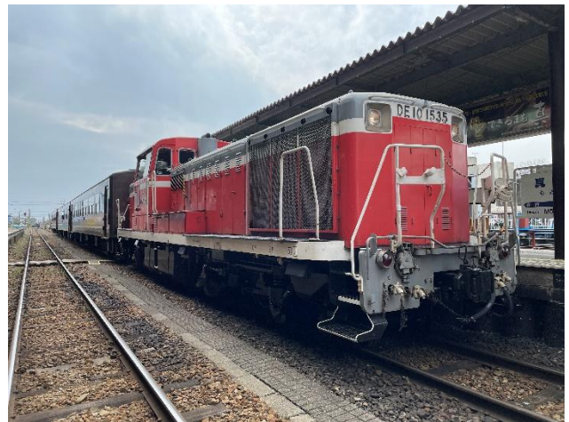
↑ 不具合が発生したDE10形機関車