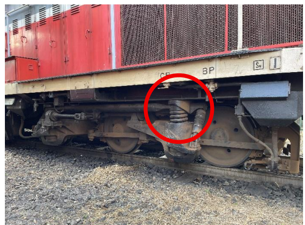
▲3軸台車の一部部品と車体(台枠)が接触している状態です。